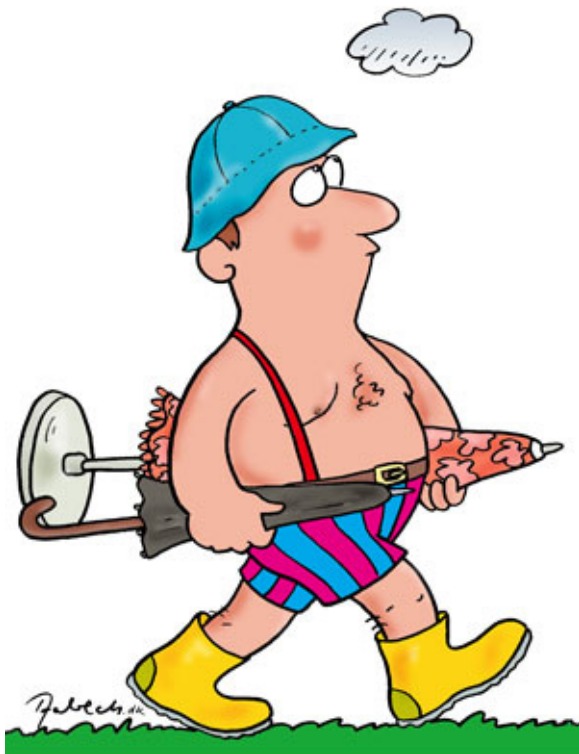
tegnning Flemming Aabech