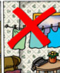
Ilup luani erroortanik manisissarnak Tør ikke tøj indendørs