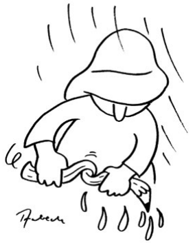
tegnning Flemming Aabech