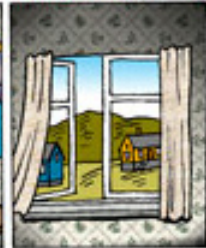
Ululut tamassa min. 3 x 3 silaannarissartarit Luft ud 3 x 3 minutter hver dag