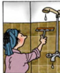
Uffareermermi likkat naterlu allartikkitt Tør vægge og gulv af efter bad