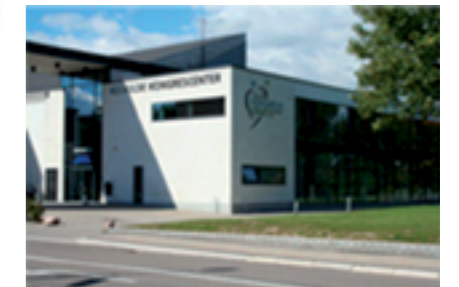
Roskilde Kongres- og Idrætscenter Onsdag den 14. og torsdag den 15. marts