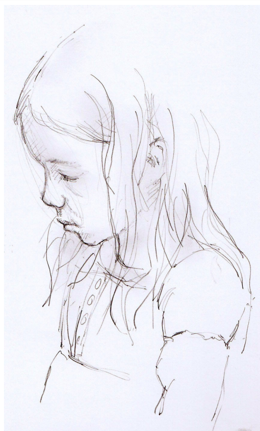
tegning Steen Malberg

Og ind imellem fik vi snakket og drukket masser af kaffe og hørt nyt om, hvad der rører sig rundt omkring.